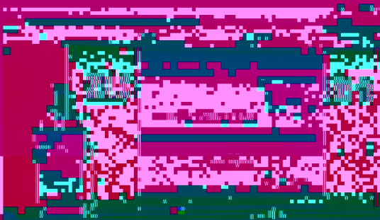
教育学院2010年度工作总结汇报现场

2010年度学术交流会于3月11日在逸夫会议中心举行。会议邀请了北京各兄弟院校的领导、专家、学者、教师代表等，围绕“教育技术”这一主题，就学科建设、人才培养、学生工作、科研工作、后勤服务工作、党风廉政建设等方面，对学院的各项工作进行了系统、全面的汇报。与会领导代表学院全体行政领导对学院行政工作进行总结，并重点介绍了学院的财务情况，并布置了2011年度的工作。会后，教育学院还与兄弟院校在博多商务酒店聚餐举行，交流并增进各单位友谊。